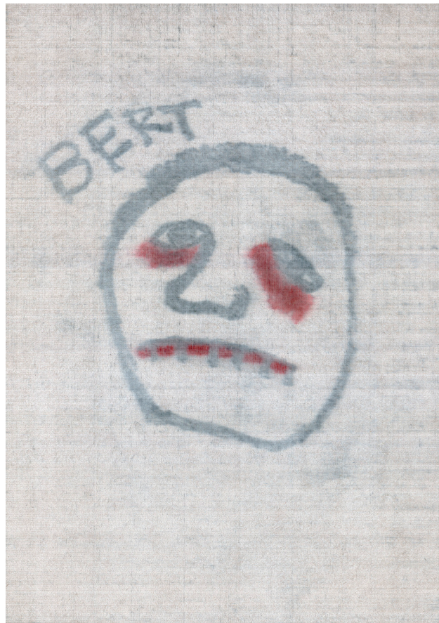
Johan De Wilde, Bert, 2010

Het discours rond beeldende kunst heeft ook een structurele dimensie. Bij subsidieaanvragen kan de impact ervan groot zijn, zoals Voorkamer vandaag ervaart. Toen de Vlaamse regering eind juni de kunstsubsidies 2017-2021 toekende, viel de vereniging van 112 032 euro terug op 0 euro – ondanks een finale beoordeling 'voldoende/goed'. De Boe en Morrens zijn het ermee eens dat de besteding van gemeenschapsgeld moet worden verantwoord, maar stellen zich wel vragen bij het nieuwe beoordelingssysteem. Zoals in elk onderzoek kleuren de onderzoeksvragen