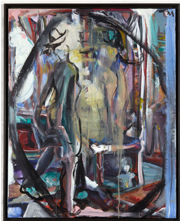
Nick Andrews, Framing Her Tale, 2015, 100 x 80 cm