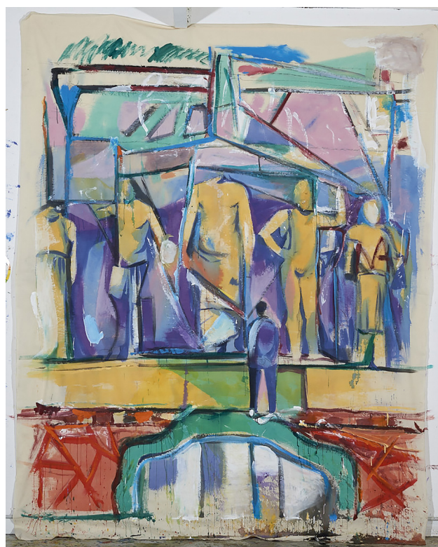
Nick Andrews, Divine Desires , 2015, 270 x 210 cm

We worden vandaag overspoeld door beelden, maar we nemen zelden de tijd om ze te laten doordringen. We beschouwen ze te vaak