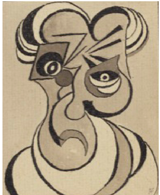
Felix De Boeck, Masker, circa 1919, Oost-Indische inkt op papier, collectie Provincie Vlaams-Brabant

Nu is de tijd rijp om De Boeck opnieuw extra muros te tonen, stelt Servellón: 'We hebben de