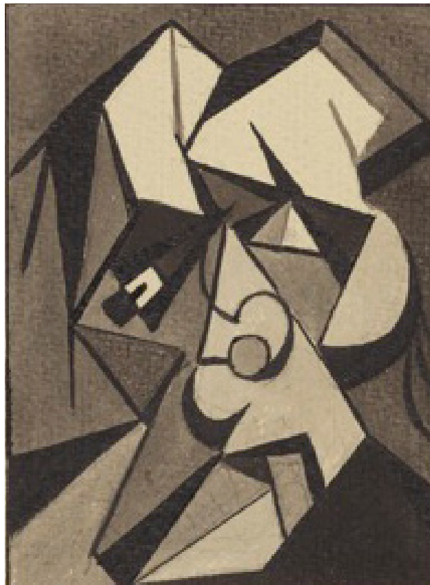
Felix De Boeck, Masker, circa 1920, Oost-Indische inkt op papier, collectie Provincie Vlaams-Brabant

In zijn werk wordt het punt waar diagonale lijnen elkaar kruisen belangrijk. Het is een lichtpunt waaruit gestileerde, uit cirkels opgebouwde insecten en dieren kunnen ontstaan. Deze cirkels,