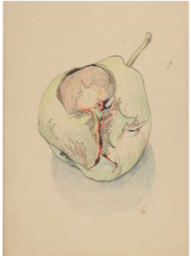
Felix De Boeck, Masker in peer (Wormsteek), circa 1930-1940, inkt en kleurpotlood op papier, collectie Provincie Vlaams-Brabant

Het is uniek hoe het tekenen bij De Boeck onderdeel wordt van de methodiek. Op het einde van zijn leven, wanneer hij in het schilderen geremd wordt door zijn fysiek, gaat hij in vroeger werk opnieuw de geometrische basis traceren. Dit symboliseren, zullen ook bepalend zijn voor bekende thema's als de moederschappen,